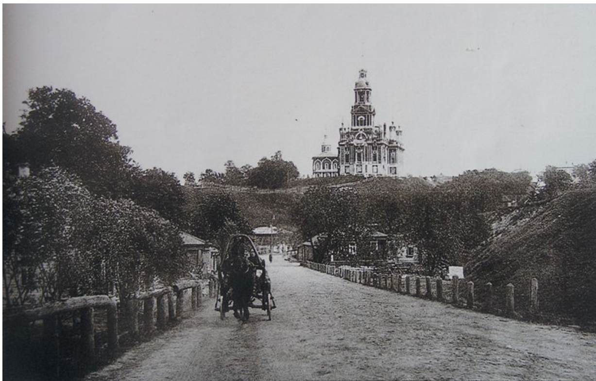
Старая Смоленская дорога в городе Можайске. Открытка начала XX века